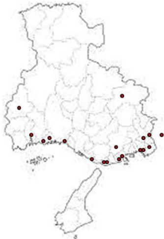
兵庫医科大学眼科関連施設の分布図（●関連施設）

この研修プログラムは、日本専門医機構が定めた専門研修施設の医療設備基準をすべて満たしており、日本専門医機構に承認されている。定められた研修達成目標は 4 年間の研修修了時に全て達成される。研修中の評価は施設ごとの指導管理責任者、指導医、専攻医が行い、最終評価をプログラム責任者が行う。4 年間の研修中に規定された学会で 2 回以上の発表を行い、また筆頭演者として学術雑誌に 1 編以上の論文執筆を行う。