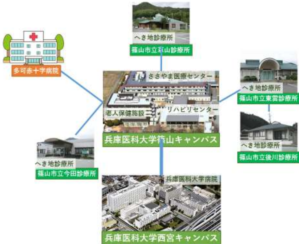
図1 兵庫医科大学総合診療専門医プログラム施設群