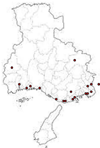
兵庫医科大学眼科関連施設の分布図 (●関連施設)

この研修プログラムは、日本専門医機構が定めた専門研修施設の医療設備基準をすべて満たしており、日本専門医機構に承認されている。定められた研修達成目標は 4 年間の研修修了時に全て達成される。研修中の評価は施設ごとの指導管理責任者、指導医、専攻医が行い、最終評価をプログラム責任者が行う。4 年間の研修中に規定された