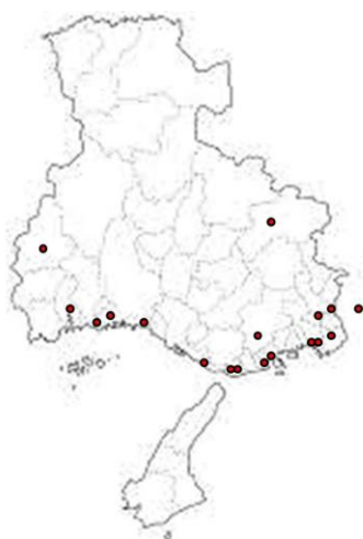
兵庫医科大学眼科関連施設の分布図 (●関連施設)

当教室は専門研修基幹施設である兵庫医科大学病院の他に関連 27 施設を有する。これらは全て地方の中堅以上の中核病院である。その中には他大学の関連病院も含んでおり、他大学とも大学の枠を超えて協力体制を敷いている。これらの施設に、当教室の医局員である約 30 名の医師が派遣されている。この多彩な現場を活かし、専門研修基幹施設だけでは経験が不足しがちな初期の一般的な疾患や眼科救急医療、各地域特有の医療事情など幅広く研修を行える場を提供する。大学附属病院での最先端の専門的診療経験と地域中核病院での即戦力となる臨床経験によって、眼科専門医を育てることが当プログラムの目指すところである。