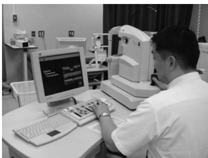
網膜の断層を観察する機器です。 4月よりOCT3000にバージョンアップします。

兵庫医科大学病院眼科は、常に患者様に最新・最良の眼科医療を提供するとともに、患者様に満足していただける診療を目指しています。同じ診療内容であっても、医療側スタッフの対応によって医療を受ける側の満足度は大きく変わりますので、医師・視能訓練士・看護師・事務系職員一同できるかぎり親切で丁寧な対応を心がけています。