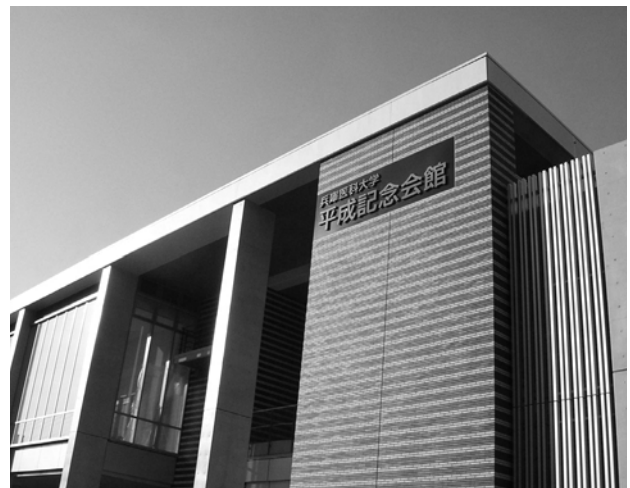
3月完成予定の「兵庫医科大学 平成記念会館」