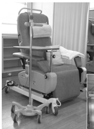
リクライニングチェア

今後は地域の中核病院として、各臓器がんの臨床、研究、教育に取り組んでまいりますので、今後とも宜しく願い申し上げます。